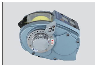
⑦P1、P2 選択ダイヤルで小型から大型ドローンまで対応