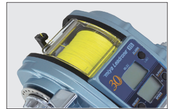
⑤全周囲対応ガイドホルダー