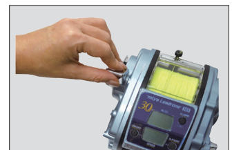
⑥リードレバーで引っ張り力を変更